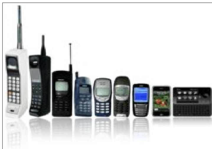
Une lignée d'objets (le téléphone portable) ayant la même fonction d'usage (communiquer) et ayant évolué dans le temps en fonction des besoins et des progrès techniques