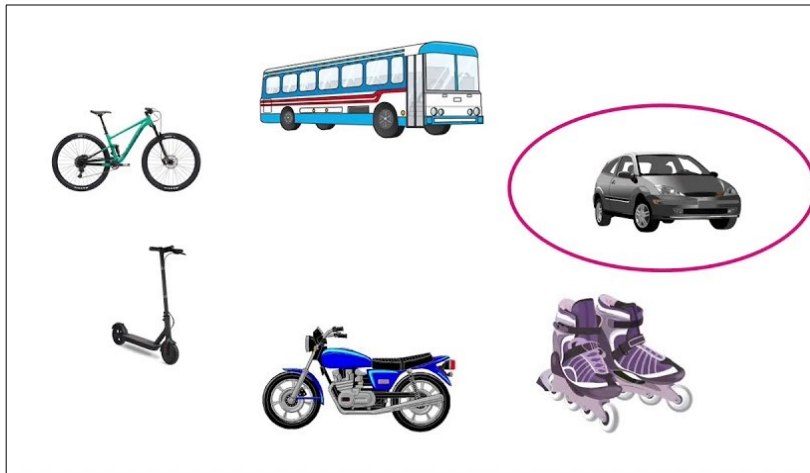
Une famille d'objets ayant la même fonction d'usage : se déplacer