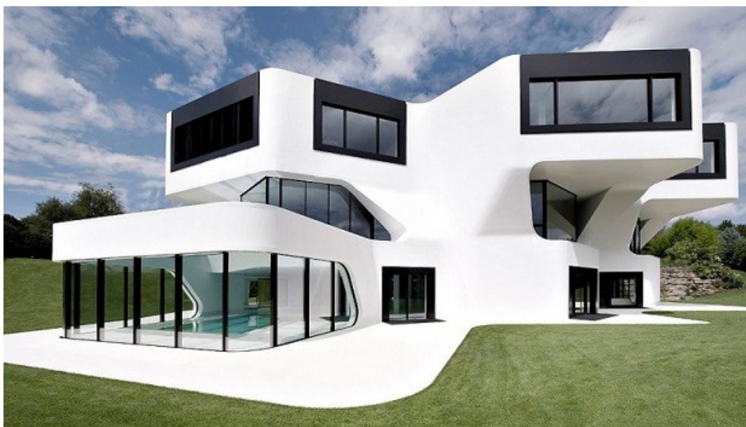
Image : une maison du future