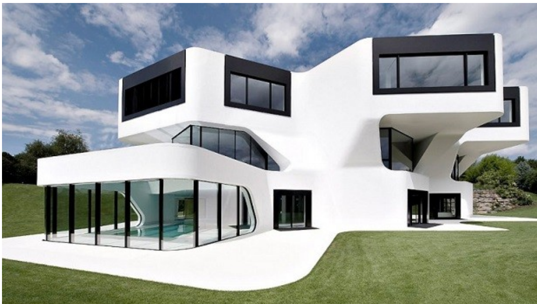
Image : une maison du future